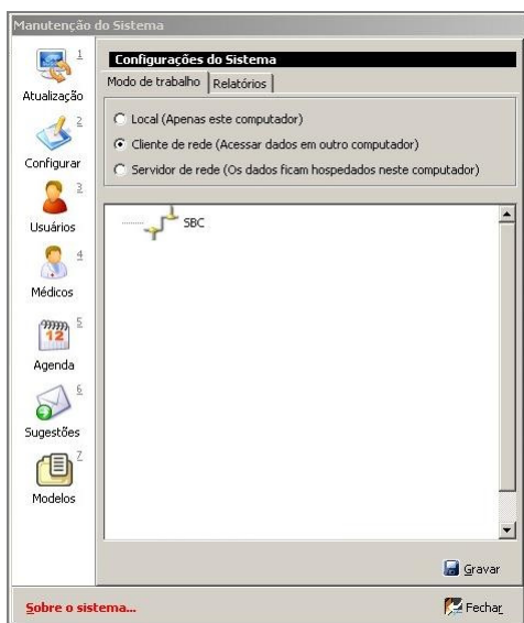
Fig. 4 (configurando como cliente)

Abra o Consultório Digital e clique na aba "Controle", depois em "Manutenção", marque a opção "CLIENTE". Aparecerá uma tela exibindo a rede configurada no ambiente. Como exemplo, vamos considerar que a rede local se chame "SBC".