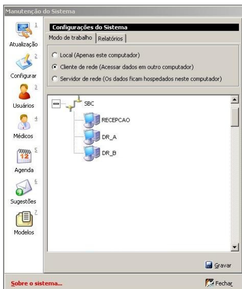
Fig. 5 (seleccionando o servidor)

Clicando duas vezes na imagem da rede, serão exibidas as máquinas que estão interligadas. Nesta etapa, será necessário apenas selecionar a figura da "RECEPCAO" (Máquina Servidora) e clicar em gravar.