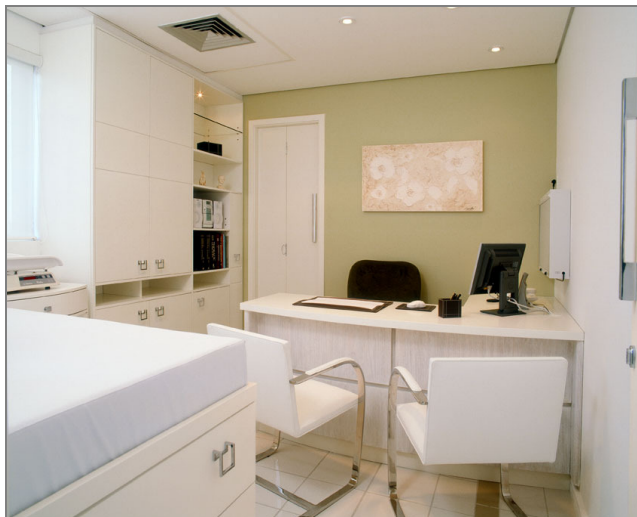
Fig. 3 (computador da sala do médico)

Todas as outras máquinas que forem utilizar o Consultório Digital (estando ligadas em rede) serão chamadas "CLIENTES", elas acessarão os dados diretamente da máquina "SERVIDOR" que, neste exemplo, chama-se "RECEPÇÃO".